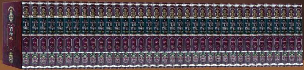
זוהר המבואר 'הכתר והכבוד'