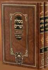
מסילת ישרים המבואר