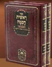
ראשית חכמה המבואר

לזכות עופר פנחס בן צילה שיחי' · קרן בת רונית שתחי' טל אדמונד שיחי' בן איזה · רונית בת ינינה יעל · בנימין בן אסתר כל יוצאי חלציהם שיחי' להצלחה רבה ומופלגה בכל מעשה ידיהם, ולאויכות ימים ושבועות טובות מתוך בריאות ונחת לעילוי נשמת צילה בת דורה צביה ומאיר ע"ה ·