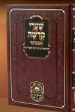
שערי קדושה המבואר