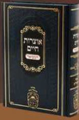
אוצרות חיים המבואר