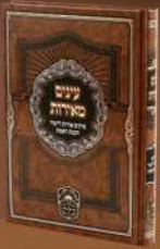
עינים מאירות קבלה