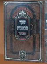
שער הכוונות פסח