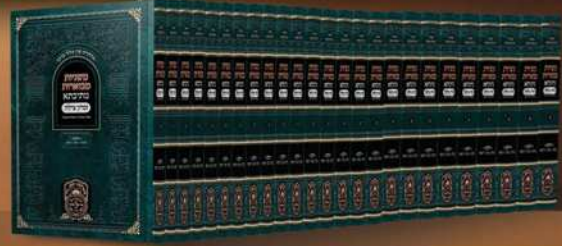
משניות מבוארות מתיבתא