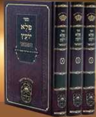
פלא יועץ המבואר