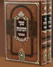
שער הכוונות ראש השנה