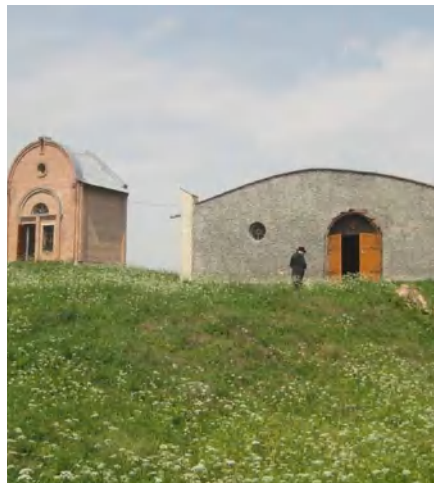
הוא ראשי תיבות בער"ש.

אמרי יוסף פר' אמור בפסוק ולקחת סולת בשם רבינו