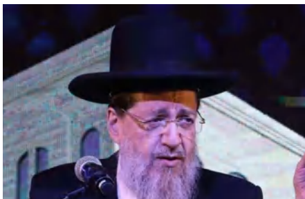
א"י המחויב רק בקידוש של שבת.

תשובה: אמנם עירוב תבשילין מתיר עשיית כל צרכי שבת ביום טוב, אך יש להדר ולא לעשות מלאכות המותרות בשבת, כי אחר שיכול לעשותם בשבת לא הותרו לעשותן ביו"ט. אומנם לסדר הבית מותר. כמו"כ אם הלכונן פוגע אצלו בכבוד יום טוב וכן בכמות מרובה של כלים כגון בחדר אוכל מוסדי שיצטרפו להמתין זמן רב עד שיטפוסם בליל שבת, אין צריך להחמיר.