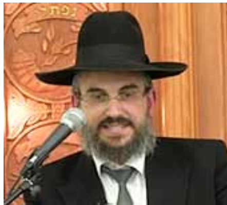
ממני ברכה שהסוס שלו ישאר חזק, שאנשים

יזמינו אותו לנסיעות, שיהיה לו כח לעשות הרבה נסיעות, וכיוצא בזה. נוכחתי לראות שהאיש הזה בוטח בסוס שלו. אמרתי: כל עוד הוא בוטח בסוס שלו - הסוס שלו ישאיר אותו למטה... רק כשיבטח בקב"ה - הקב"ה ישפיע עליו את כל הברכות. לכן לקחתי לו את הסוס, ולא נותר לו אלא לבטח בקב"ה, ואז הכל נהיה אחרת..." המשיך רבי דוד ואמר: "לכל יהודי יש את 'הסוס' שלו, שעליו הוא סומך. רק אם יתחזק באמונה ובטחון בקב"ה, יעזוב את הסוס הזה ולא יתלה עליו יהבו, יזכה לסייעתא דשמיא, ולשפע ברכה וישועה".