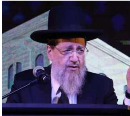
המתפלל לצורך מצוה.

תשובה: למרות שני הטעמים הנ"ל שהובאו לאיסור לעבור לפני המתפלל (א. ביטול הכוונה. ב. הפסקה בין השכינה – משנ"ב קב, טו), בשעה שמסמן שיעברו אמנם אינם מפריעים לו בכוונה, אך לכאורה מפסיק לשכינה. אכן בשעת הדחק ניתן לסמוך ולהקל אף באחד הטעמים, ולעבור לפניו.