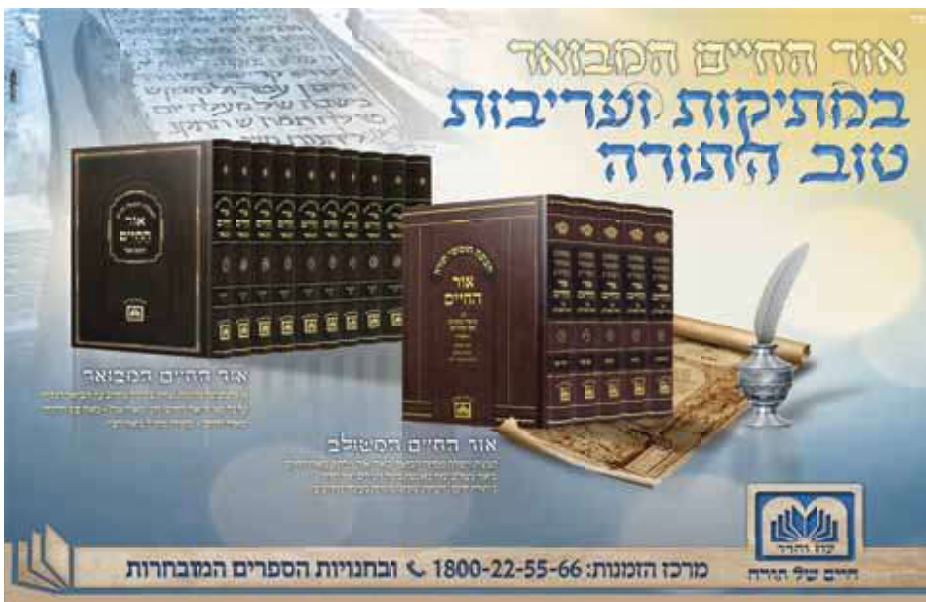
נוצוב ועימוד: שוקי קטר

אלא, הסביר הרבי, נראה לומר שיוסף הצדיק עבד את ה' בהתלהבות רבה, בעזו ובתעצומות. יעקב אבינו ראה את עבודתו של יוסף הצדיק ומתוך כך בא להוכיח את שאר בניו השבטים, באומרם אליהם: ראו את ההבדל ביניכם ובין יוסף אחיכם, שיוסף עובד את ה' בכל כוחו ואילו אצלכם אין רואים את עבודתכם.