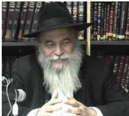
בביתך, הרשיני לישון כאן, באסם! "אין על מה לדבר", הקשיח השוחט ליבו.

נאה הוא הסיפור, אך יחטיא את מטרתו אם נאמר לעצמנו: אני איני שוחט, ואיני מגרש אנשים... יתבונן כל אחד ויראה, שבלחץ החיים והטרדות נשחקים רגשות ומופריים איזונים, וחובה עלינו לעמוד על המשמר. אם ששת ימי המעשה מושכים לחומריות - נקדיש את השבת לרוחניות. אם מנותקים הם מהמשפחה - תוקדש השבת לחיזוק הקשר, ללימוד עם הילדים. תשיב אותנו אל עצמנו, למשפחתנו, ותשיב את האיזון הנכון! (הגאון רבי שלום מאיר וולך שליט"א - בקראת לשבת עונג)