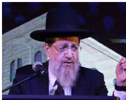
ברכת כהנים, או שיש לעמוד דווקא מלפניו.

רבינו הגר"ש אלישיב זצ"ל הידר לעמוד דווקא מול הכהנים, למרות שמקום עמידתו בחזרת הש"ץ היתה בשווה לצידם. ואף בשנותיו האחרונות שקשתה עליו ההליכה ביותר, התאמץ לפסוע אחורנית לכיוון מרכז בית הכנסת בכדי שלא יעמוד בשווה אלא לפני הכהנים, ובאחת הפעמים כשהבחין שעוד כהן נוסף בשורה קדמית, אף שהיה זה רק כהן קטן המברך מדין חינוך, הוסיף להטריח עצמו ופסע עוד מעט אחורנית, בכדי שגם ברכת הקטן תהא מלפניו (ציוני הלכה - ברכת כהנים סא).