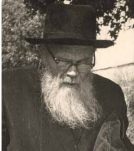
התשי"א התמנה למנהל רוחני בישיבת כנסת חזקיהו שבזכרון יעקב.

פעם קרה שאחד מילדיו עשה עוולה גדולה, הוא חיכה שבועיים עד שהרגיש בעצמו שלא נשאר בלבו אפילו שמץ כעס, ורק אז ייסר אותו. (גליון סיפורי צדיקים)