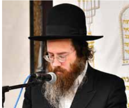
פסולים, אך מן הדין אין צורך בכך.

אך נראה שאינם דיברו על תפילין של זמננו, שהם חזקים ועשויים מעור בהמה גסה, ולפיכך לא מצוי שיכנס זיעה, ואין ענין לבדוקם. ואדרבה, מצוי מאוד שע"י הוצאת הפרשיות והחזרתם לצורך הבדיקה, הדיו מתפרק והכתב נפסל. ויש שבודקים פעם בשנים רבות [כגון לפני החתונה], מכיון שלעיתים נדירות כן מוצאים