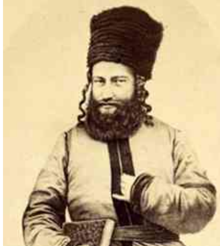
גדולה מלאכה שמכבדת את בעליה (נדרים מט, ב).

נ"ב שמעתי להקשות דהרי ר' שמעון בן יוחאי אומר אפשר אדם זורע בשעת זריעה [וכו'] תורה מה תהא עליה (ברכות לה, ב) הרי ששונא הי' את המלאכות. ואין שלימות אצלו רק שלימות התורה לבד.