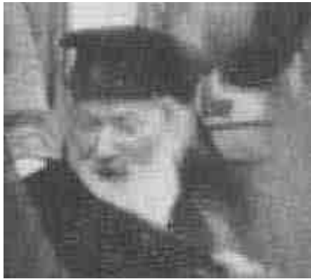
רבינו נתבקש לשייבה של מעלה ביום כ"ד אלול שנת תרצ"ג, זי"ע.

מסופר, בעירו של מרן החפץ חיים היה סוחר אחד, שהיה מאחר לסגור את חנותו בערב שבת, ובמוצ"ש היה ממחר לפתוח אותה. הוכיחו הח"ח, ואמר לו אמשול לך משל למה הדבר דומה, לאותו גוי כפרי שלא ידע קרוא וכתוב, והיה מביא את סחורתו לשוק מדי שבוע, והיה מוכר אותה לסיטונאי, וכדי לדעת כמה שקים הוא מוכר לסוחר, היה מוריד את כובעו, ועל כל שק שמוריד, שם הקונה מטבע, ואח"כ סופרים את המטבעות, ויודעים את מספר השקים. והנה הכפרי מוריד שק, והסוחר שם מטבע, עד שהכובע נתמלא במטבעות. הכפרי חיכה עד שהסוחר לא ראהו, ולקח חופן מטבעות ושם בכיסו, והסוחר אף שהרגיש בדבר, עשה עצמו כלא ראהו, ואמר בלבו שיבוסם לו, הלא מעצמו הוא גונב. ואחרי שהוריק את כל העגלה, ספר את המטבעות, ושילם לו בהתאם, והכפרי הלך שמח בהרגשה שרימה את הסוחר. בחזרתו לכפרו סיפר לחבריו איך רימה את הסוחר, וגנב ממנו חופן מטבעות. 'טיפש' צעקו עליו חבריו, הלא מעצמך גנבת, ועל כל מטבע שגנבת, הפסדת שק. אמר החפץ חיים לסוחר, הלא כל ששת הימים מתברכים מהשבת ככתוב בזוהר "כל שיתא יומין מניה מתברכאן", וכל מה שמאריכים את השבת, הברכה שורה ביתר שאת לששת הימים, ואילו אם מקצרים את השבת גם הברכה מתקצרת.