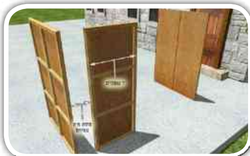
ואם היא רחוקה מהדופן שכנגדה יותר מעשר אמות [שהם 4.8 מטר לדעת הר"ח נאה, ו-5.76 מטר לדעת החזו"א], הסוכה פסולה. 25