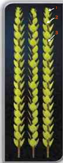
(1) עלים העליונים. (2) עלי ההדס. (3) ענף.