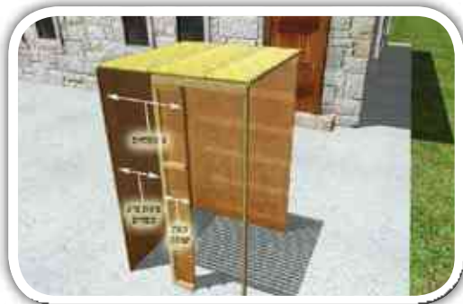
אופן חיבור שני הדפנות הצמודות

הנחשבת כמחיצה. אמנם יש האומרים שמדין 'צורת הפתח' צריך שיהא רוחב האויר של הפתח לפחות ארבעה טפחים, לפי שאין דרך פתח להיות צר פחות מארבעה טפחים רוחב 14 . מ"ב ע"ה תר"ל ציור ב'