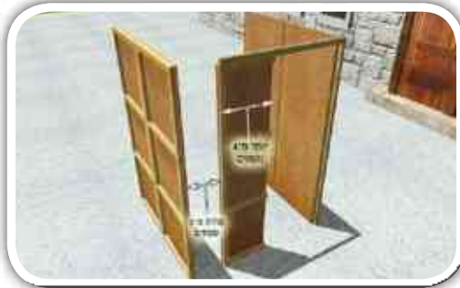
ה. וכשהדופן הנוספת הינה בשיעור ז' טפחים, אין צריך צורת הפתח. 24 מ"ב עו"ה סי' תר"ל ציור י"ב.