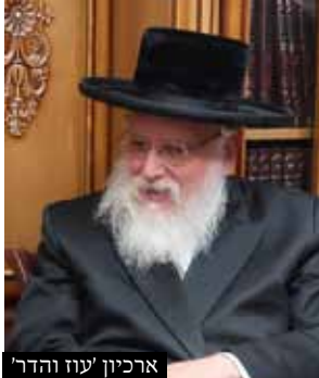
ארכיון 'עוז והדר'

שאלה: אפה לחמניות וקודם האפייה הניח עליו חתיכות קטנות של בצל שחתכם בסכין בשרי, האם מותר לאכול את הלחמניות.