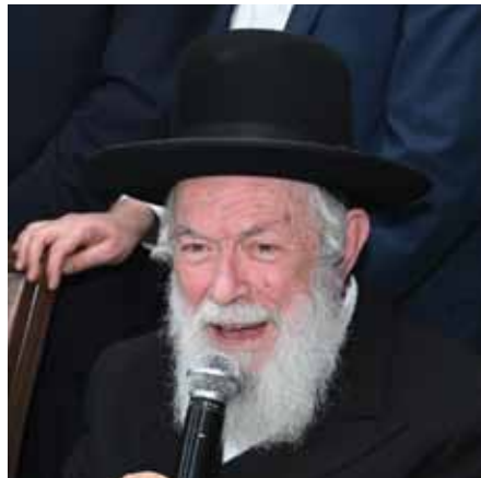
הרגל של עכשיו, אף דהוא ודאי.

הגאון רבי יצחק זילברשטיין שליט"א רבה של שכונת רמת אלחנן בבני ברק