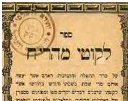
שבת בשבתו - אנטוורפן

אמרינן בשבת (דף קי"ט) חמין במו"ש מלוגמא, פת חמה במוצאי שבת מלוגמא, פי' רש"י חמין לשותות ולרחוץ, מלוגמא רפואה, והנה לרחוץ בחמין במוצ"ש לא נהגו בשום מקרה, וגם לאכול פת חמה לא ראיתי לדקדק, אלא שבלקוטי מהרי"ח הביא שהמהר"ם א"ש דקדק לאכול פת חמה (ואף דאמרו ביומא דפת חמה סכנה היינו דוקא חמה ביותר, או דהגמ' ביומא מיירי בפת חמה היוצא מן התנור שנאפה בו, אבל אם אחר שכבר נתקרר מחום האפיה ועבר זמן מה ורוצה לחממו מחדש שפיר דמי, ע"י בארחות חיים), אמנם לשתות חמין כבר נתפשט בין חסידים ואנשי מעשה ששותין קאווע או טייה במוצ"ש.