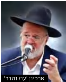
ארכיון 'עוז והדר'