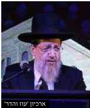
ארכיון עוז והדר

שאין יוצאים בשמיעה זו שום דבר שחייבים לשומעם מפי אדם". והרחיב בזה במנחת שלמה (קמא א, ט הערה 4). ולאחר שהתעמק רבות במכשיר שמיעה שהותקן לאמו, היה קורא לפניו בפורים את המגילה כשהיא אומרת אחריו מילה במילה מתוך המגילה הכשרה (עדות בנו הגרא"ד אויערבאך).