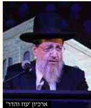
ארכיון עוז והדר

שאלה: האם ניתן לברך ברכת האילנות רק בחודש ניסן, וכגון מי שיצא בימי אדר וראה אילנות מלבליים, האם יברך עליהם מיד או ימתין עד חודש ניסן. וכן מי שלא בירך בניסן האם יכול לברך גם בחודש אייר.